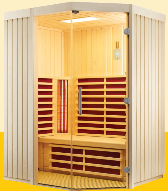
Abb. Holzart Espe

Infrarotkabine in 4 verschiedenen Breiten wählbar (1536 / 1622 / 1708 / 1794 mm)