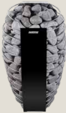
SPIRIT E (Separate Steuereinheit erforderlich)

Das mit einem separaten Steuergerät ausgestattete Modell Harvia Spirit E ist mit seinen vielseitigen Anschlussmöglichkeiten nicht nur für den privaten, sondern insbesondere auch für den professionellen Einsatz ideal.