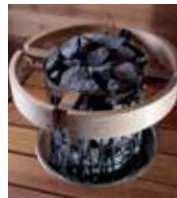
Schutzgeländerring HPC3 (6,8/9,0 kW)