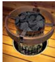
Schutzgeländerring mit LED-Licht HPC3L (6,8/9,0 kW)