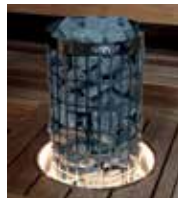
Beleuchteter Ein- baurahmen HPC2L (6,8/9,0/10,8 kW)