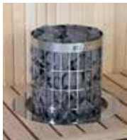
Einbaurahmen HPC1 (6,8/9,0 kW)