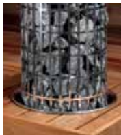
Einbaurahmen HPC2 (6,8/9,0/10,8 kW)