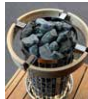
Schutzgeländerring HPC4 (10,8 kW)